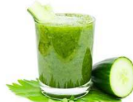
3. Alimento, jugo o batido