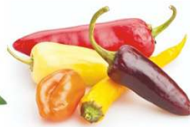
6. No caigas en mitos

En resumen, llevar un estilo de vida saludable hará posible disminuir el porcentaje de grasa, si tienes dudas y necesitas consejos personalizados consulta a un nutriólogo con título y cédula. ¡Aprende a comer! Vive saludable.